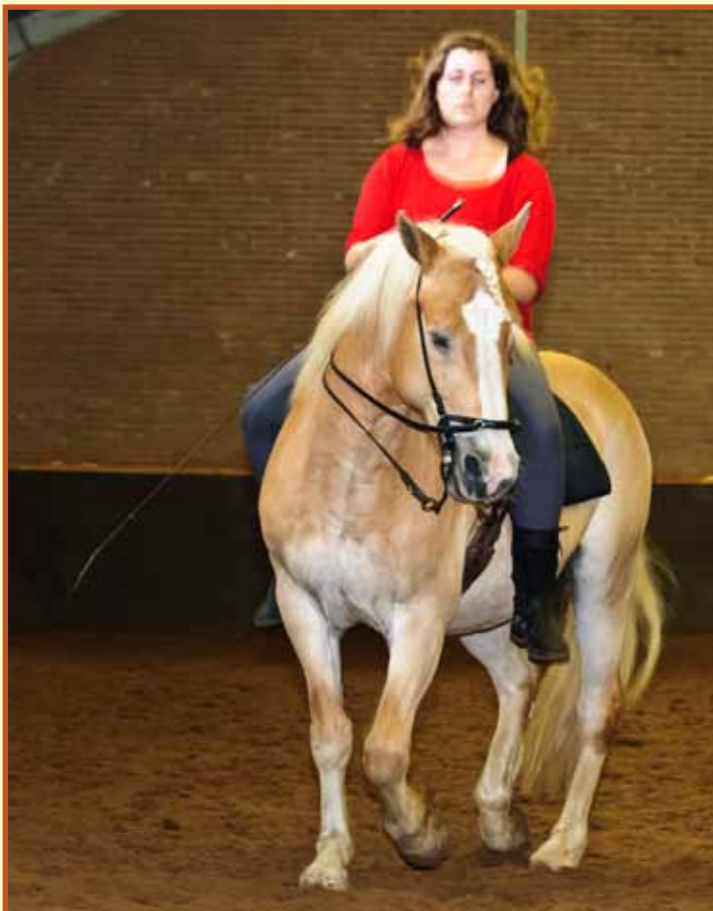
Een verrassing was deze Haflinger, die een les mocht meedoen en net zo serieus en statig de oefeningen uitvoerde als zijn Spaanse collega's.